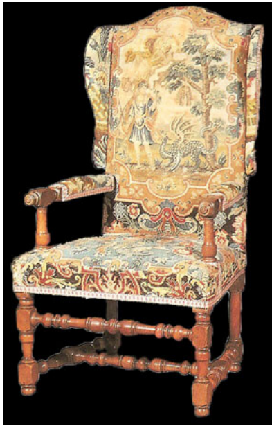
Fauteuil à oreilles

La ville est en relation avec l'Espagne, les Flandres et même l'Afrique et le Brésil, ce qui lui vaut de recevoir, à l'automne de 1562, les premiers Indiens d'Amérique débarqués en