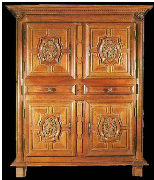
Armoire dite à quatre portes. Celle-ci est dite de Pierre Corneille et daterait de 1660

Le premier apparaît d'une étonnante richesse, la seconde, d'une rare élégance dans la discrète finesse de son incomparable sculpture. Le bois, bien normand, reste un chêne de haute valeur, objet de soins attentifs, qu'on ne débite pas à la scie mais à la hache, afin d'éviter de gauchir les ais. L'ébénisterie rouennaise semble exceptionnellement maîtrisée. Le mobilier de Rouen offre le rare intérêt de faire percevoir l'évolution qui, du coffre médiéval, aboutit à l'armoire classique. Le coffre, perché sur un haut piétement devient crédence ou dressoir, s'ouvrant, en façade, par deux petites portes (début XVII ème ). Apparaît un peu plus tard l'armoire quatre-portes, dont la forme révèle bien la superposition de deux coffres, chacun à deux portes. Ils font corps avec une ceinture intermédiaire où se trouvent des tiroirs (milieu XVII ème ).